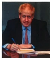
THE PRIME MINISTER